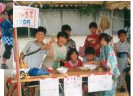
藤城小学校児童による販売コーナー（昨年）