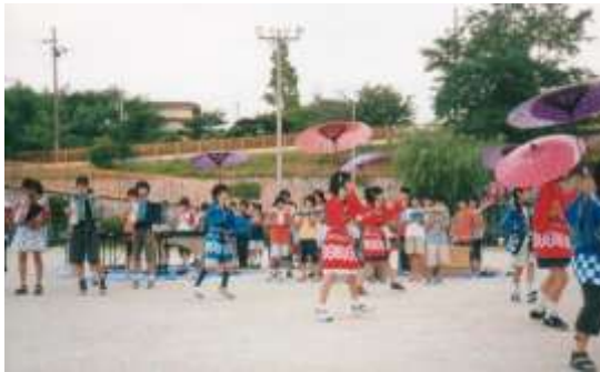
藤城小学校児童の演技（昨年）