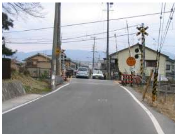
現在の JR 踏切