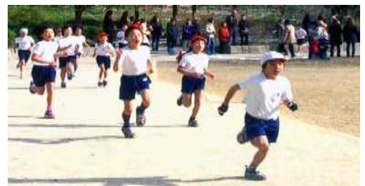
応援ありがとうございました。多数の声援のおかげで最後まで走りきれました。