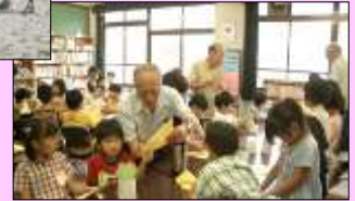
6月26日(土) 楽しい理科の実験