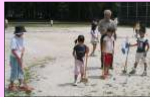
6月19日(土) グランドゴルフ