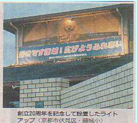
創立20周年を記念して設置したライトアップ（京都市伏見区・藤城小）

伏見・藤城小 校章をライトアップ 「20歳」光で盛り上げ 新年度に、創立二十周年記念式典へ向けての藤城小で、節目を祝う機運を地域あげて盛り上げようと、校舎壁面の校章を飾り付けたライトアップが行われている。 同小は一九八六年四月に開校、新年度が二十周年にあたる。ライトアップは、同校区の各種団体や歴代のPTA会長、同小でつくる記念事業委員会を取り付けた。「好きで 校舎の北東角、三階部分の壁面にある校章を頂点にして、底辺約十メートルの壁面に松組を配飾。三角形の中に二十周年を表す20の数字も入れ、赤、青、緑の三色の電飾を取り付けた。「好きで 二十一日まで午後六時から十時まで点灯している。その後も、同小を会場に行われる地域の夏祭りなどで随時点灯し、住民に二十周年の節目をPRする予定。