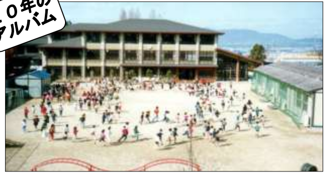
平成 5 年 2 月 プレハブ校舎と新校舎建設工事によって 半分の広さになった運動場