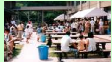
10年前 創立10周年記念「藤城フェスタ」の様子 (平成7年8月6日)