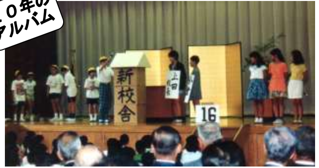
平成 5 年 9 月 1 日 新校舎竣工式