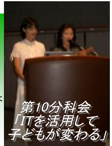
第10分科会 「ITを活用して 子どもが変わる」