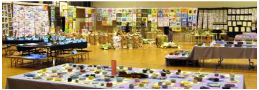
平成 19 年 2 月 28 日～3 月 2 日 藤城小学校「造形展」