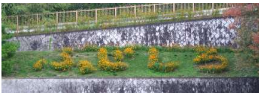
平成 20 年 10 月 コスモス満開の藤城小学校の花文字「ふじしろ」