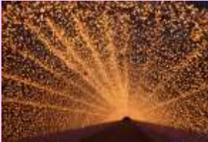
「なばなの里~ ウインターイルミ ネーション」