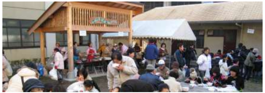
12月7日 藤城少補「もちつき大会」で活躍するなかまどんランド