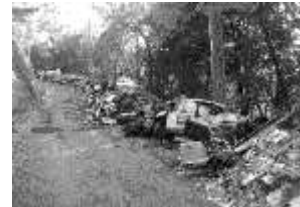
道路下から拾い上げられたゴミの山