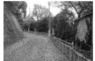
撤去後の竹柵と啓発看板