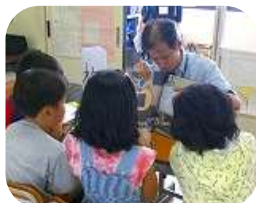
ゲームソフト開発