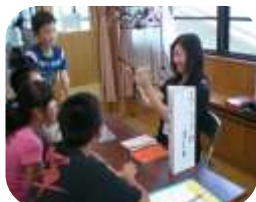
シンクロナイズドスイミングコーチ

4年生は社会科「くらしとごみ」の学習で、地域のゴミについて調べました。6月15日には、かつて産業廃棄物の不法投棄の問題があった場所を見学し、周辺の地域の人たちの活動によりきれいになったというお話を聞かせていただきました。