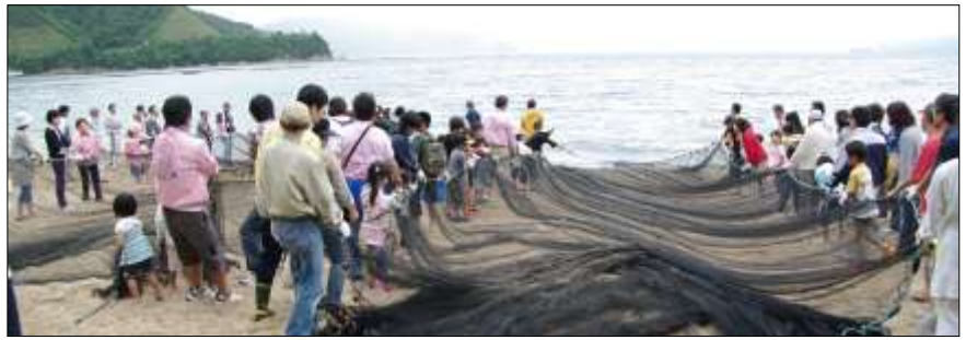
6月7日 少年補導委員会「地引網体験に行こう！」(福井県 敦賀湾気比海岸)