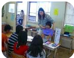
カラコーディネーター

今年度5年生は、総合的な学習で「つかもう!みんなで夢を」をテーマに、いろいろな仕事について調べたり、職業体験をしたりして、仕事や生き方について考えていくことにしました。その学習のひとつとして、6月20日の休日参観の時に地域や保護者の方をゲストティーチャーとして招き、お話を聞きました。それぞれのお仕事についての内容や仕事への思いなどを身近な方からお聞きし、子ども達は、いろいろな発見をすることができました。