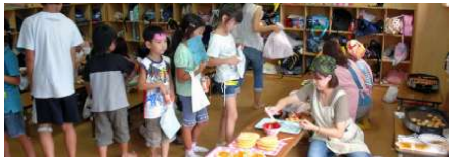
8 月 21 日 藤城児童館「ふじっこなつまつり」