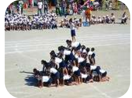
心ひとつにきまった! 6年生【未来へ2009】