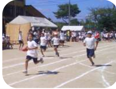
ゴールめざして 力いっぱい駆けた!