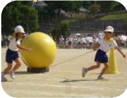
はじめての運動会 1年「外体」かてつぱしれ