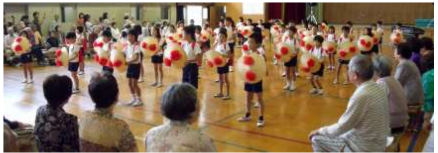
9 月 13 日 (日) 第 11 回 藤城シルバーの集い (藤城小学校 2 年生による花笠音頭)