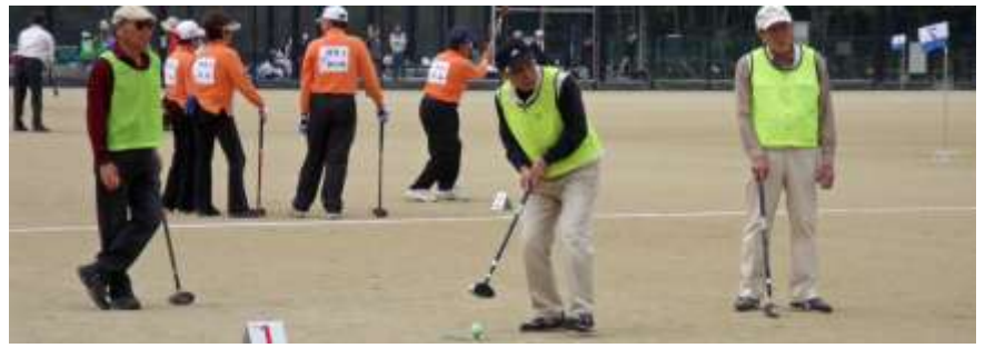
10月25日(日)第7回 伏見区民グラウンド・ゴルフ大会(伏見桃山城運動公園)