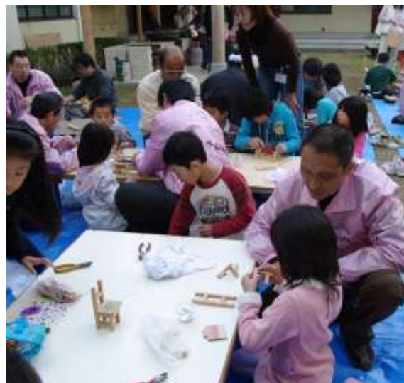
平成 20 年度 PTAオータムフェスタ 2008 より