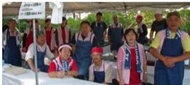
ヤキソバコーナー担当の藤城体育振興会の皆さん

10 月 18 日（日）、藤森神社において第 19 回深草ふれあいプラザが開催され、大勢の参加者が模擬店コーナーやステージ、伝承あそびコーナー、お楽しみ抽選会などで楽しみました。藤城学区の各種団体も様々なコーナーの協力をいたしました。