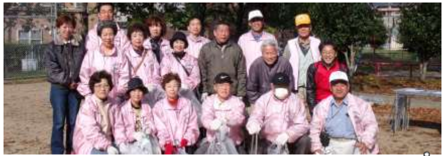
11月21日(土)大岩山周辺地域清掃活動に参加の皆さん