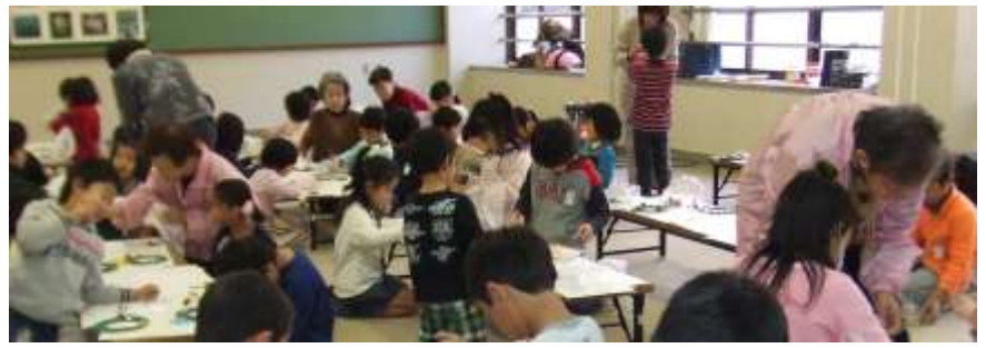
12月17日(木) スクール21「クリスマスリースを作ろう」(女性会)