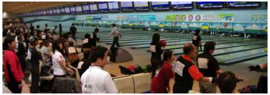
1 月 10 日 ( 日 ) 第 40 回 伏見区民ボウリング大会 (MKボウル山科)