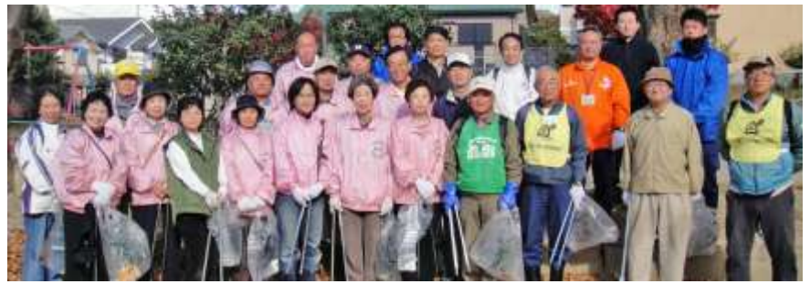
11月27日(土)大岩山一斉清掃 参加者の皆さん(東古御香公園)