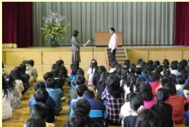
平成23年3月24日(木) 伝達式(藤城小学校 体育館)

平成23年3月、「藤城みまもり隊」が学校安全ボランティアとして「子どもの学びと育ちを支援する」という熱い思いのもと、様々なみまもり活動を通して学校・家庭・地域の連携を深めつつ子ども達の安心と安全のため献身的に取り組んだ活動に対して、京都市教育委員会より感謝状が授与されました。