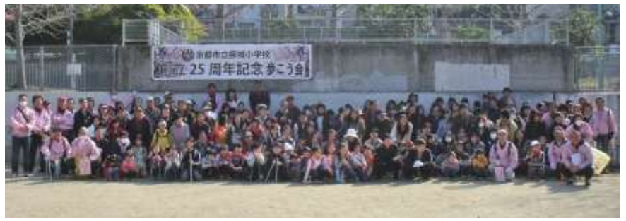
平成 23 年 3 月 13 日 (日) 第 21 回 藤城歩こう会 参加者の皆さん