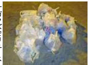
残されていたゴミ

夏まつりで使用したリユース食器を、間違っ て持ち帰られた方は、8月末頃までに学校へご 返却ください。お近くの児童にことづけていた だいても結構です。よろしくお願ひします。