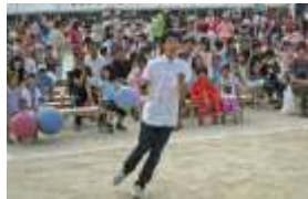
京都大道芸倶楽部