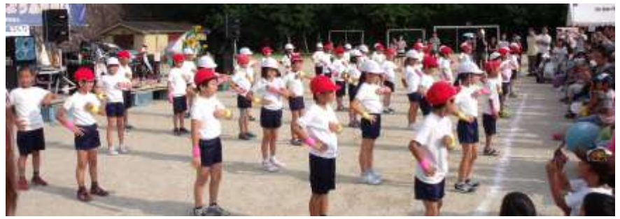
第 13 回 藤城夏まつり 藤城小学校 3 年生のダンス「100%勇気」