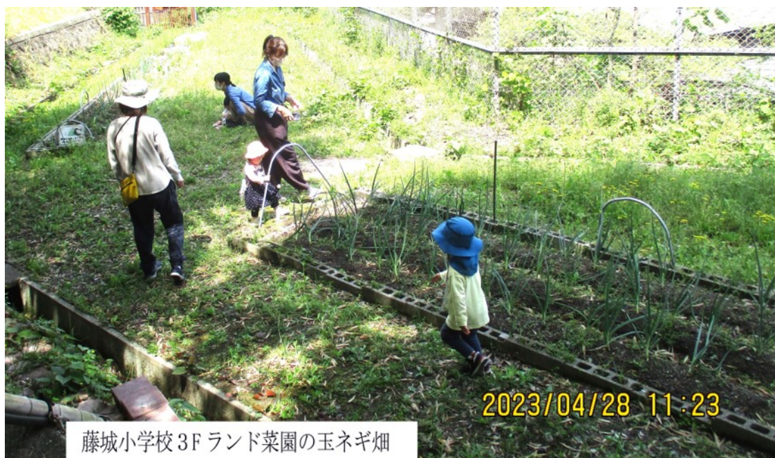
藤城小学校 3F ランド菜園の玉ネギ畑

藤城学区社協の福祉事業に関する経費は、伏見区社協からの助成金・地域の賛助会員様よりいただく「賛助会費」の分担金によって運営させていただいております。本年度も6月の委員会にて趣旨の説明とお願いをさせていただきたく思っております。本年度も地域の皆様のご指導とご協力を賜わりますことをお願い申し上げます。