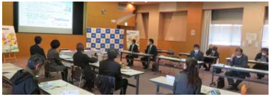
令和3年3月15日(月) 「深草いいトコ体感プロジェクト」の始動に関する連携協定の締結式(深草支所)