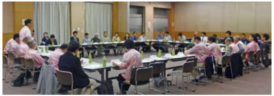
平成31年4月23日(令和元年度)藤城学区自治連合会総会の様子(深草支所) 来年度はこのような形で総会が開けるようになることを願います。