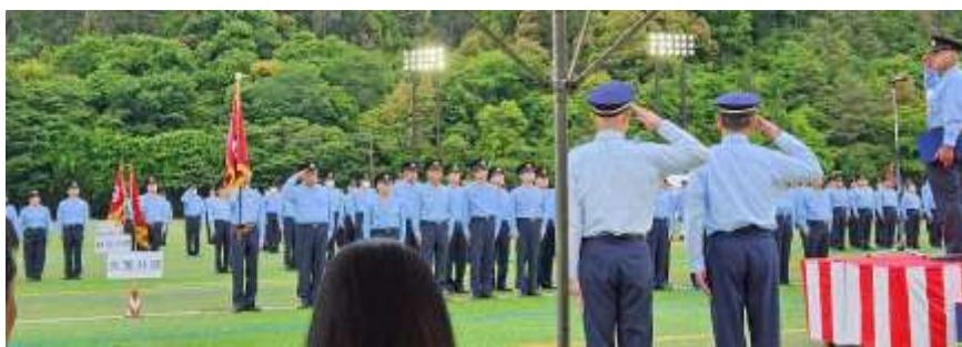
令和6年5月19日(日) 令和6年度 伏見消防団総合査閲(龍谷大学 南大日グラウンド)