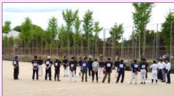
☆サンデースポーツの実施内容につきましては、藤城学区のホームページ「チーム藤城 オンライン」をご覧ください。