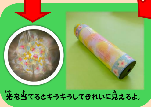
ひかりを当てるとキラキラしてきれいに見えるよ。

まんげきようの筒は、好きな柄を選んで、自分だけの好きなまんげきようが作ることが出来るよ!