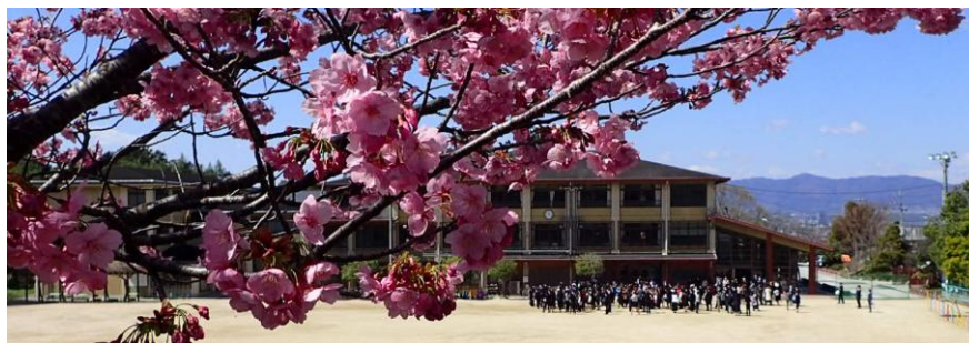
令和2年3月23日(月)卒業式(京都市立藤城小学校)