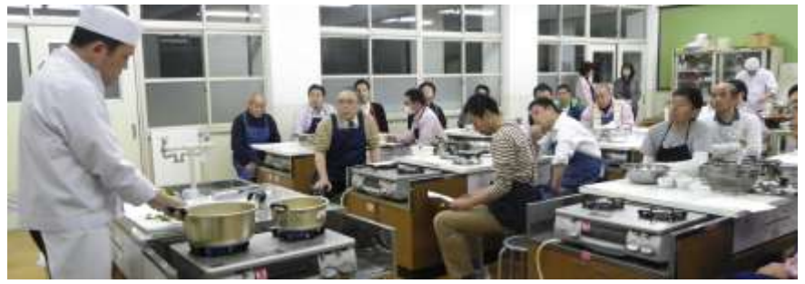
平成 25 年 4 月 12 日 (金) おやじの会「男の料理教室」