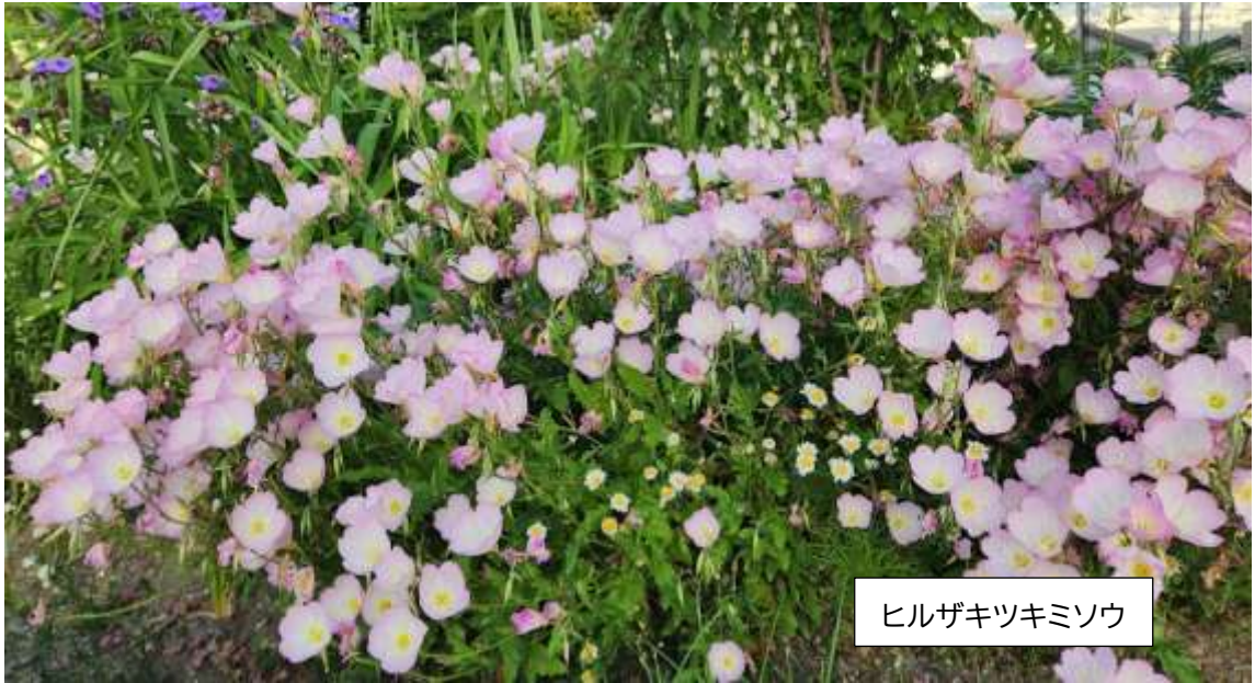
ヒルガキツキミソウ